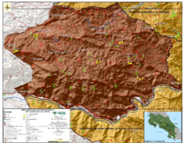
Territorio: Boruca, Pueblo Brunka. PRESENTE.