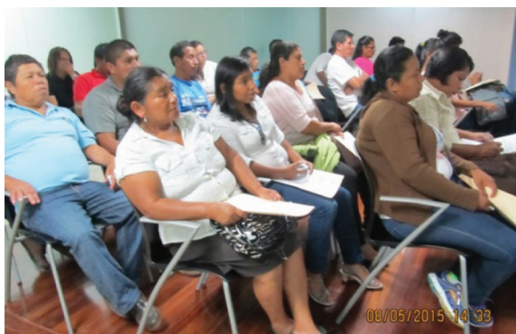
Talleres de la Mesa Nacional Indígena de Costa Rica.

Además del valor que para el Estado costarricense tiene la biodiversidad, para los pueblos indígenas es de gran trascendencia cultural, por ello desde siempre se han dedicado a su conservación mediante sistemas propios, mismos que no necesariamente han sido entendidos por la sociedad y menos tomados en cuenta en políticas, estrategias, planes y proyectos impulsados por el estado. Sistemas que fueron debilitados por el propio estado y que nunca han sido abandonados por los indígenas.