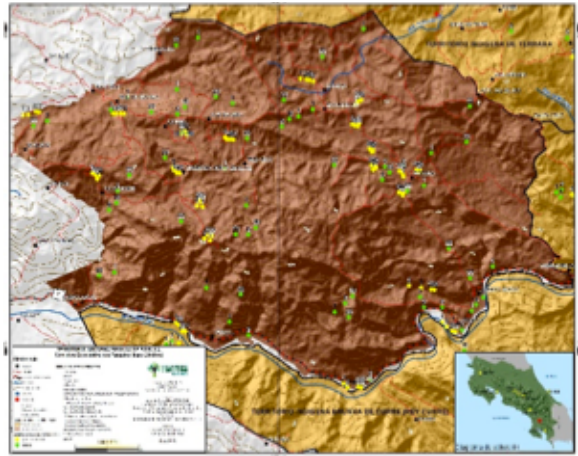
Territorio: Boruca, Pueblo Brunka. PASADO.