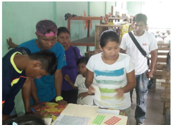
Talleres de la Mesa Nacional Indígena de Costa Rica.