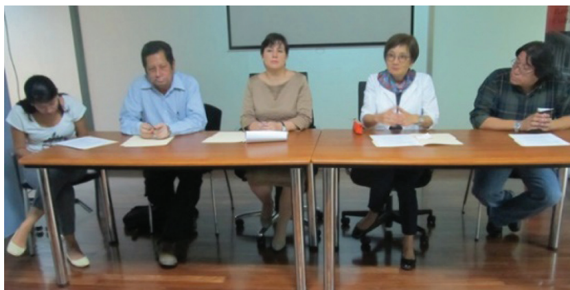
Talleres de la Mesa Nacional Indígena de Costa Rica.

de un mecanismo que facilite la construcción de nuevas formas de relacionamiento entre el Estado – Gobierno y los Pueblos Indígenas. También es una forma en donde las comunidades indígenas pueden expresar un requerimiento a instancias públicas para que se incorporen sus visiones en temas que no requieren un proceso de CONSULTA.