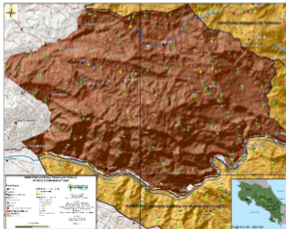
Territorio: Boruca, Pueblo Brunka. FUTURO.